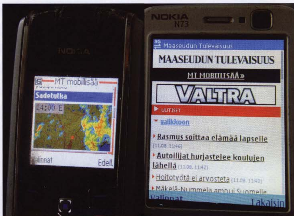
Mobiililehden teksti näkyy kännykän ruudulla yhtä hyvin kuin tavanomaiset tekstiviestitkin.

MOBIILILEHDESSÄ JULKAISTAAN SAMOJA UUTISIA kuin lehden verkkoversiossakin. Siksi uuden kanavan käyttöönotto ei aiheuta